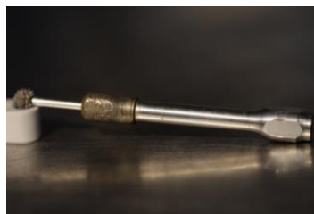
Figuur 8 Verlengstuk geschikt voor Dremel. Op dit stuk tot een kleine bolvormig raspje (zie fig. 7, kleiner model). Met dit verlegstuk kan je diep in holtes werken.