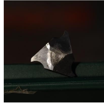
Figuur 3 Driehoekige bit met 'haken'. Er bestaan twee maten. Kies voor de kleinste als je er maar één koopt. Men kan er 'scherpe' tekeningen mee maken in het hout.