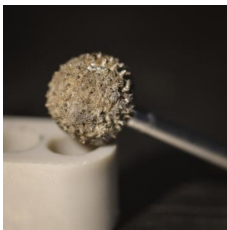
Figuur 7 Bolletje met scherpe stekels. Geschikt om holtes mee uit te werken. Bestaat in twee maten.