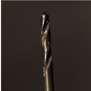
Figuur 1 Gewoon houtboortje. Geschikt om gaten te maken en groeven te trekken bij zacht hout. Hier opgenomen om te kunnen vergelijken.