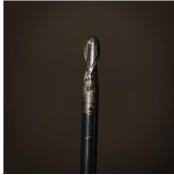
Figuur 2 Dit is geen boortje! Het heeft een afgeronde top. Geschikt om diep uit te frezen maar ook om groeven te trekken. Haalt hout weg met de top maar ook met de zijkant. Dit is een basis tool!