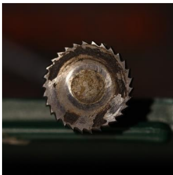
Figuur 4 Dit lijkt op een zaagblad maar het is wat dikker. Geschikt om shari uit te werken, bv aan de rand.