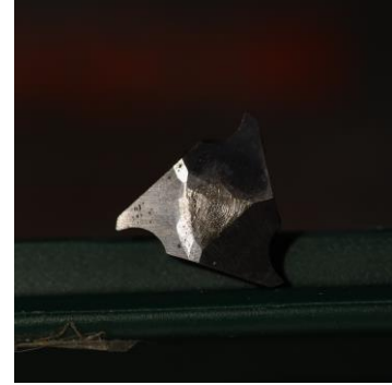
Figuur 3 Driehoekige bit met 'haken'. Er bestaan twee maten. Kies voor de kleinste als je er maar één koopt. Men kan er 'scherpe' tekeningen mee maken in het hout.