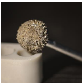
Figuur 7 Bolletje met scherpe stekels. Geschikt om holtes mee uit te werken. Bestaat in twee maten.