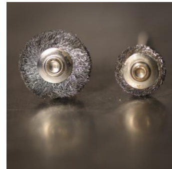
Figuur 6 Staalborstel. Kies voor de borstels van het merk zelf. Die gaan veel langer mee en de draadjes komen niet los tijdens het frezen. Rechts een nagenoeg opgebruikt borsteltje. Gooi die niet weg. Je kan er groeven en dergelijke mee verfijnen.