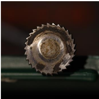
Figuur 4 Dit lijkt op een zaagblad maar het is wat dikker. Geschikt op shiri uit te werken, bv aan de rand.