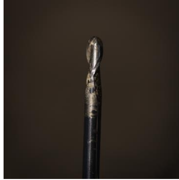
Figuur 2 Dit is geen boortje! Het heeft een afgeronde top. Geschikt om diep uit te frezen maar ook om groeven te trekken. Haalt hout weg met de top maar ook met de zijkant. Dit is een basis tool!