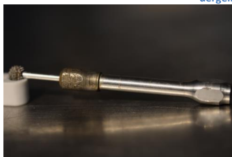
Figuur 8 Verlengstuk geschikt voor Dremel. Op dit stuk tot een kleine bolvormig raspje (zie fig. 7, kleiner model). Met dit verlegstuk kan je diep in holtes werken.