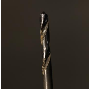
Figuur 1 Gewoon houtboortje. Geschikt om gaten te maken en groeven te trekken bij zacht hout. Hier opgenomen om te kunnen vergelijken.

Al deze freeskoppen werden speciaal ontworpen voor het bewerken van dood hout op bonsai. Ze zijn van een zeer goede kwaliteit en gaan in de regel zeer lang mee (20 jaar en meer).