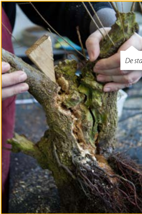
De stam is helemaal gespleten!