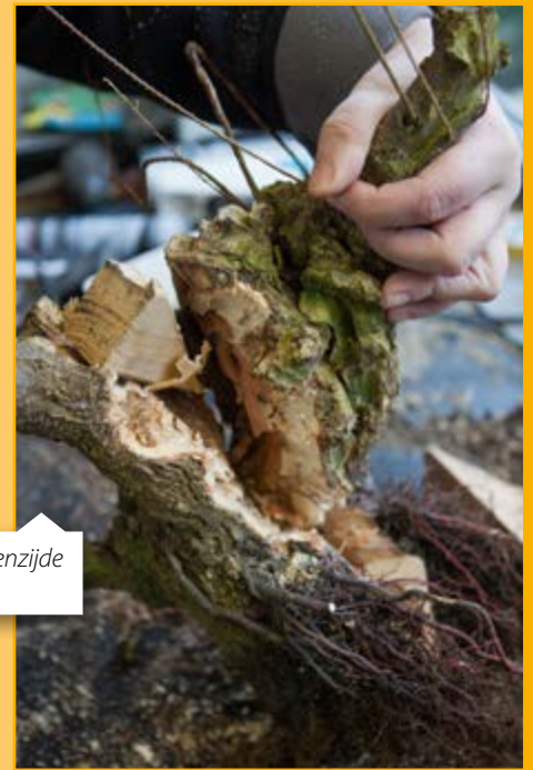
Werk met een tweede wig aan de bovenzijde van de stam.