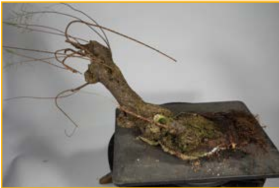
Het deel met de 'lelijke' stam.