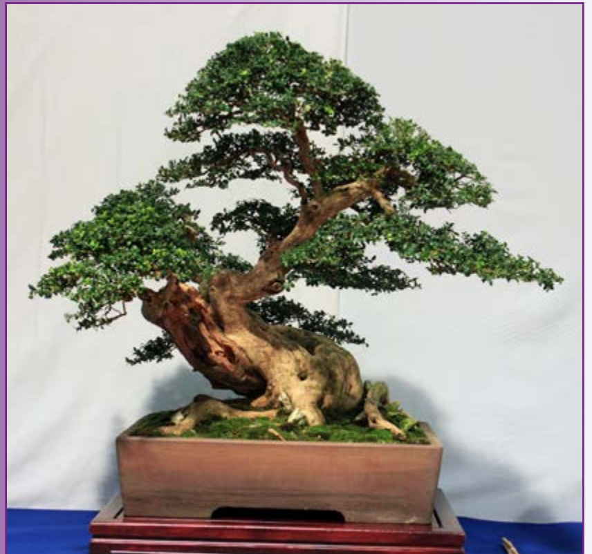
Ook Buxus hoort er bij, en wat een kanjer.