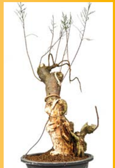
De al te rechte stam valt niet zo erg meer op. Door freeswerk aan de rechter zijde zal dit in de toekomst nog veel verbeteren. Beeld je een kruin in die drie jaar ouder is dan deze.