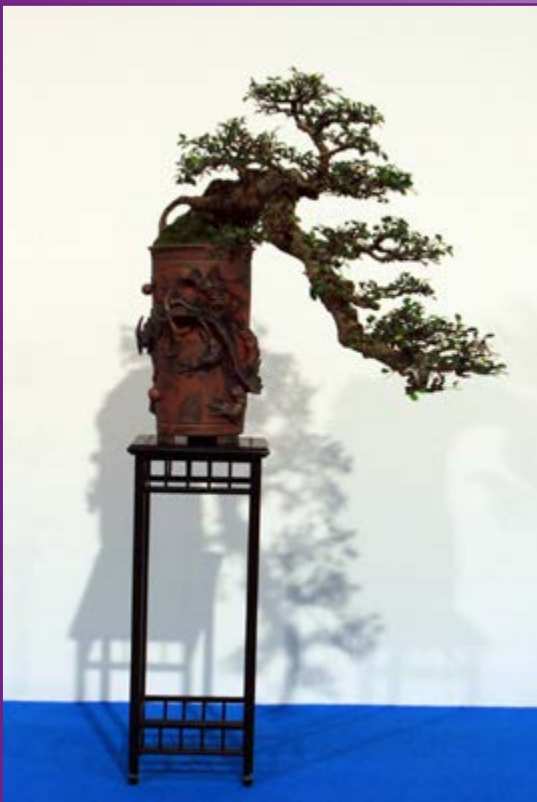
Wat krijgt meest aandacht, de pot of de boom?