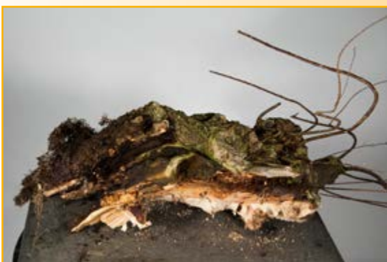
Het deel met het vele dode hout.